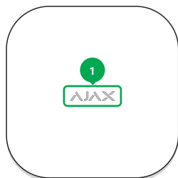
1 - Logo de Ajax con indicador luminoso